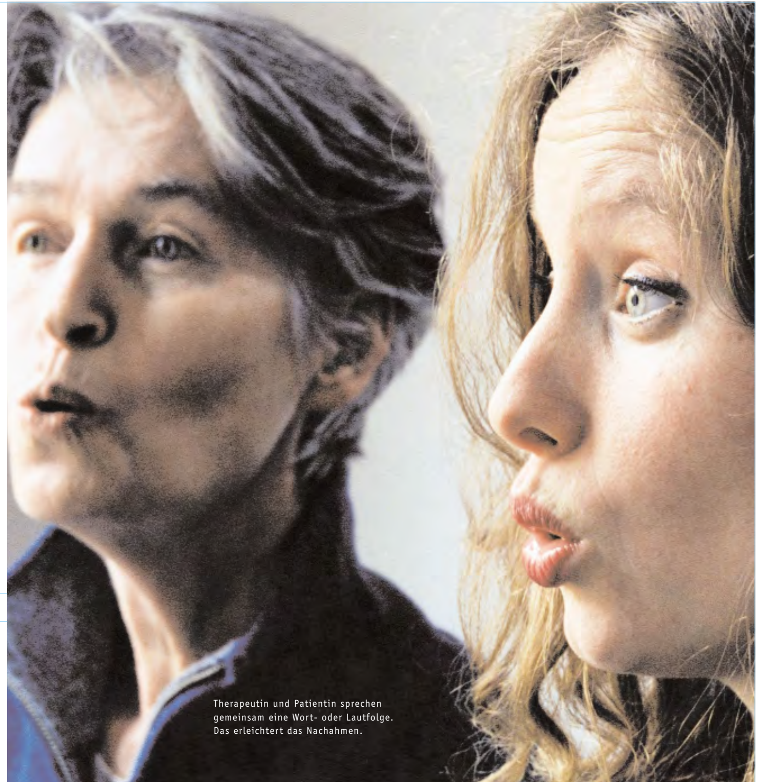
Therapeutin und Patientin sprechen gemeinsam eine Wort- oder Lautfolge. Das erleichtert das Nachahmen.