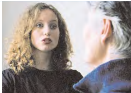
Vorbild und Nachahmung: Die Therapeutin spricht vor, die Patientin versucht, die Worte oder Laute in ihrer Aussprache möglichst originalgetreu nachzusprechen.

Die therapeutische Sprachgestaltung ermöglicht also nicht nur die Behandlung von Sprach- und Sprechstörungen, sondern ebenso den gezielten Umgang mit unterschiedlichsten Krankheiten im internistisch-allgemeinärztlichen sowie im psychosomatischen, psychiatrischen und heilpädagogischen Bereich, da sie grundlegend in das Verhältnis von Körper, Seele und Geist eingreift.