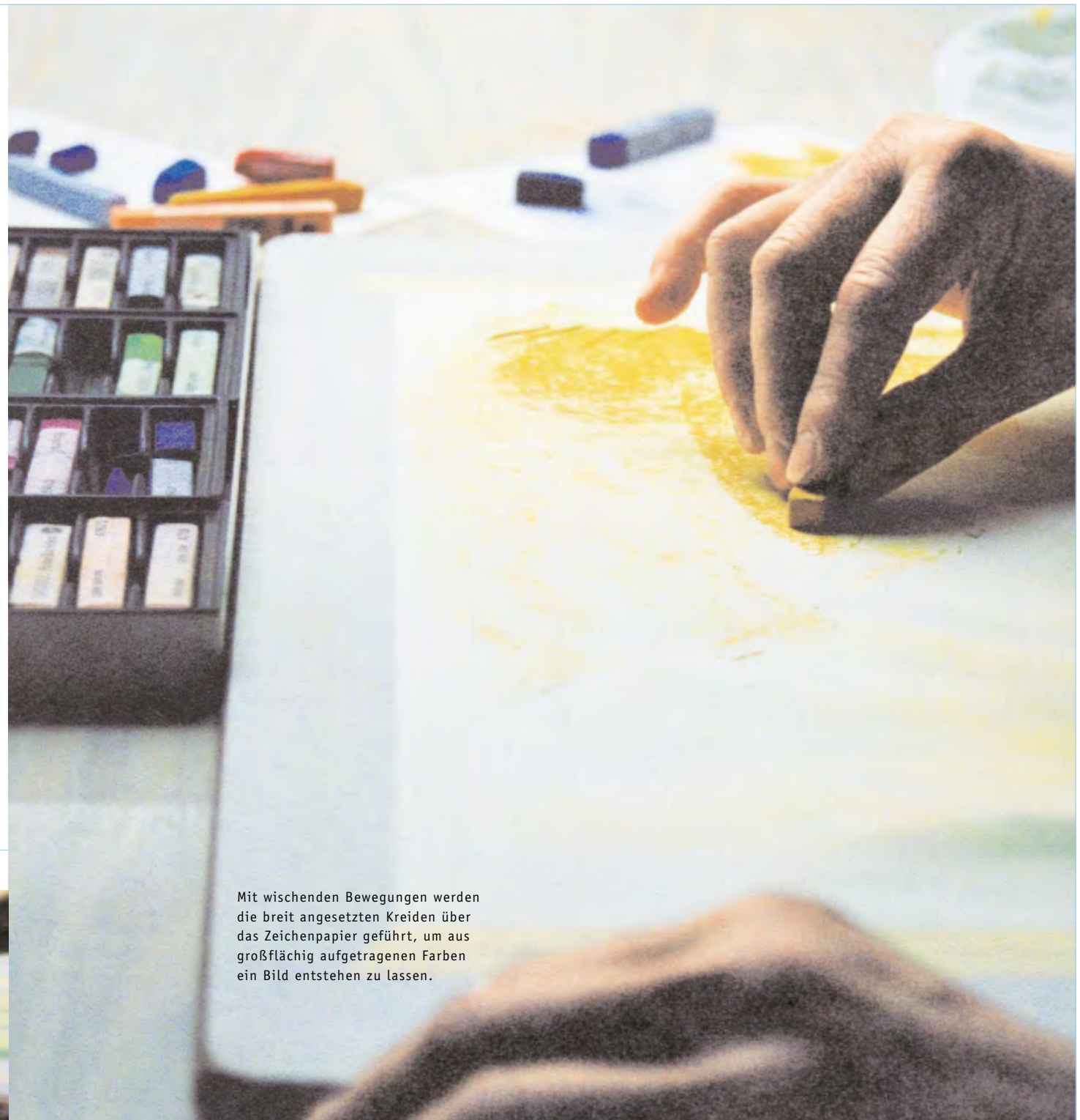
Mit wischenden Bewegungen werden die breit angesetzten Kreiden über das Zeichenpapier geführt, um aus großflächig aufgetragenen Farben ein Bild entstehen zu lassen.