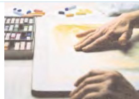
Therapeutisches Malen und Zeichnen (links), Musiktherapie (rechts) sowie rhythmische Massage (ganz rechts) gehören zum weiten Spektrum anthroposophischer Behandlungsmöglichkeiten.