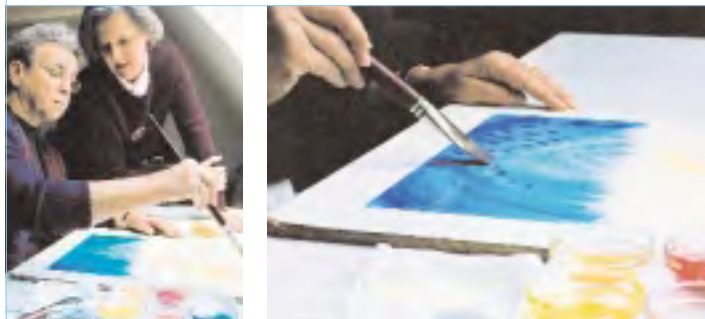
Die Auswahl der Farben und der Maltechnik – trocken mit Kreide (rechts) oder Nass-in-Nass mit Aquarellfarben (links) – richtet sich nach dem therapeutischen Ziel.

Das Malen bewirkt – je nach Material und Methode – unterschiedliche Vorgänge: Die Farbe stimuliert Sanftheit oder Leidenschaft, Ernst oder Heiterkeit, Mut oder Zurückhaltung. Es regt die Vorstellungskraft an und stärkt den Willen. Der Malende ergreift die Farbe, bewegt und gestaltet sie. Er nimmt und gibt, verdichtet und löst, differenziert und verbindet, lässt gewähren und entscheidet, entwickelt Nähe und Distanz. Das Erleben dieser inneren Verhaltensgegensätze im rhythmischen Wechsel vermag krankheitsbedingte Einseitigkeiten aufzulösen. Auf diese Weise wird ein Prozess der Selbsterkenntnis angeregt, kommen Verhaltensweisen und Lebensmuster ans Licht, Hemmungen und Blockaden, die bisher verborgen waren und auch Bezug zur Krankheit haben. In der Kontinuität des therapeutischen Zeichnens und Malens lassen sich eingefahrene Strukturen lösen und verwandeln und sogar Traumata bewältigen (auch bei Kindern).